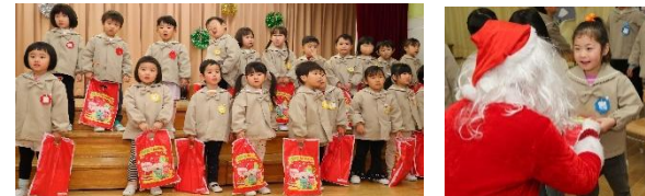
仙台中央郵便局 クリスマスイベント